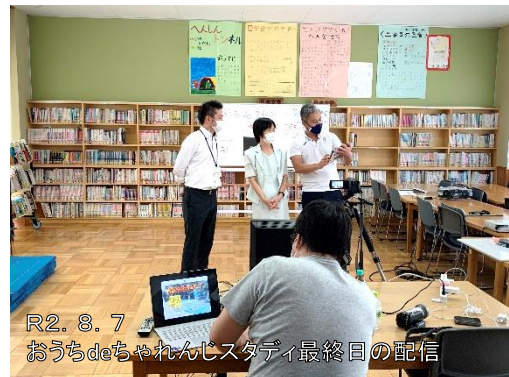
R2. 8. 7 うちdeちやれんじスタディ最終日の配信

校長先生をはじめとする先生方にも多大なるご協力をいただきながら、毎日のおもしろ学習クイズ、歌の練習、ものづくり体験、読み聞かせ、キッズヨガ、パネルシアターなど、本当に多彩な3日間を子供達と過ごすことができました。本市においても、 GIGAスクール構想の実現 に向けて、 ICTを活用した教育環境 の整備に力を入れています。今後のヒントになると良いなと考えています。