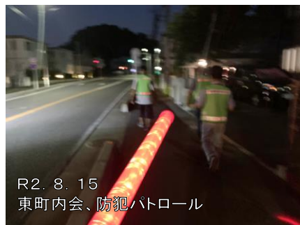
R2. 8. 15 東町内会、防犯パトロール

元々は福祉や民事、企業法務関連の相談をお受けすることが多かった弊所ですが、議員活動をするようになってからは、実に多くの相談が寄せられるようになりました。 道路や交差点の改良、ボランティア団体、保育や学校教育、公害への対応、河川管理や不法投棄、公園美化など、他にも沢山の困りごと相談をいただいております。