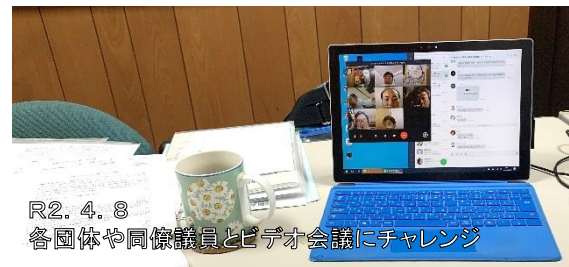
R2. 4. 8 各団体や同僚議員とビデオ会議にチャレンジ

庁内各部署だけでなく、商工会等との連携が必要な手続きもあります。横断的な連携が必要なものや、同時に複数の課題を抱える場合も想定されることから、ワンストップで対応できる体制整備を提案しました。