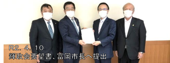
R2. 4. 10 輝政会要望書、富岡市長へ提出