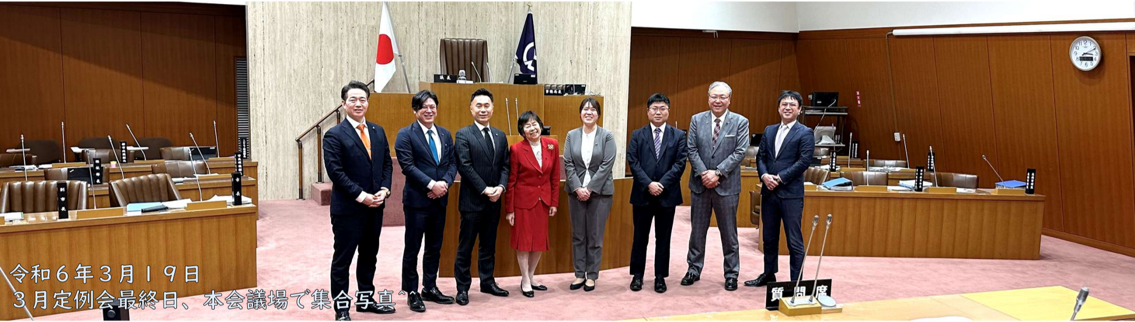
令和6年3月19日 3月定例会最終日、本会議場で集合写真

令和6年度の市役所の仕事を決める3月定例会予算審議。新人には初の本格論戦となりましたが、あさか未来は是々非々で審査に臨みました。改良を望む点はあるものの、市民生活に必要な予算案であることを見極め、総額51.2億2百万円一般会計予算の原案には賛成。一方、全庁横断的な推進体制整備が急務のデジタル化推進については、更に加速させるために高度な専門人材を外部登用する予算修正案を提出しました(※1)。また、本市教職員が強制わいせつ容疑で逮捕された去年の事件、組織運営上の管理責任を誰も負わず、求めている丁寧な説明もないまま現教育長の再任案を提出された市長に対し、被害者や保護者の立場から問題点を指摘し反対しました(※2)。