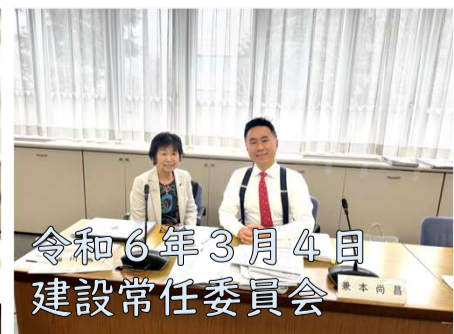
令和6年3月4日 建設常任委員会