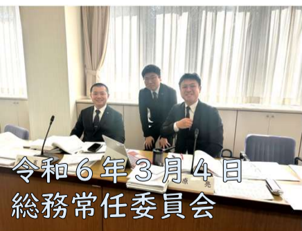
令和6年3月4日 総務常任委員会