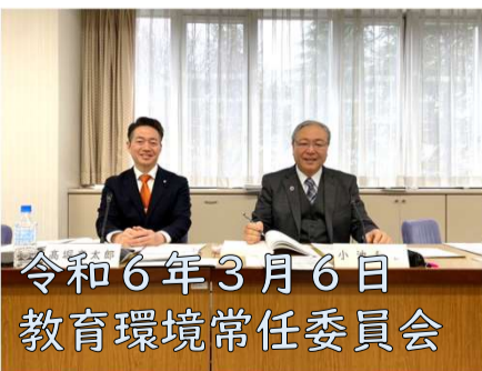
令和6年3月6日 教育環境常任委員会