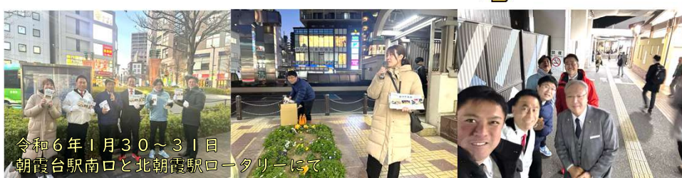
令和6年1月30～31日 朝霞台駅南口と北朝霞駅ロータリーにて