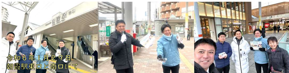
令和6年1月29日 朝霞駅東口と南口にて